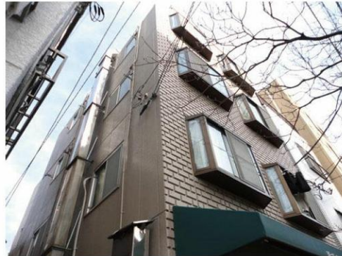
※掲載の写真は現在入居中のため、別室の写真となります。

敷金：1ヶ月 礼金：1ヶ月 共益費等：1,000 円 契約期間：2年間（更新可） 現況：居住中（3/5 空き予定） 更新料：新賃料 1ヶ月分 火災保険：加入要（16,000 円～） 契約事務手数料：16,500 円 アクセス 24：16,500 円 鍵交換費用：16,500 円～ 保証会社：利用必須（総賃料 80%～）