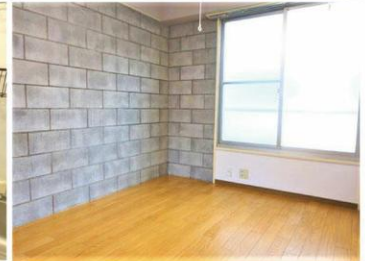
※掲載の写真は、現在リフォーム中のため、入居前の写真になります。