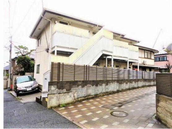
【ライフインフォメーション】

敷金：1ヶ月 礼金：1ヶ月 共益費等：無し 契約期間：2年間（更新可） 現況：居住中（3/23 空き予定） 更新料：新賃料 1ヶ月分 火災保険：加入要（16,000 円～） 契約事務手数料：16,500 円 アクセス 24：16,500 円 鍵交換費用：16,500 円～ 保証会社：利用必須（総賃料 80%～）